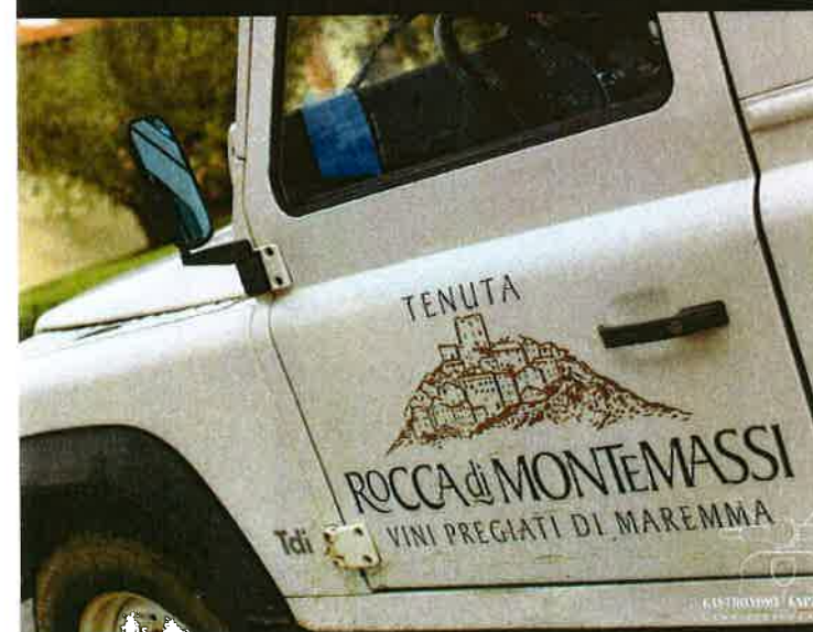
Tenuta Rocca di Montemassi